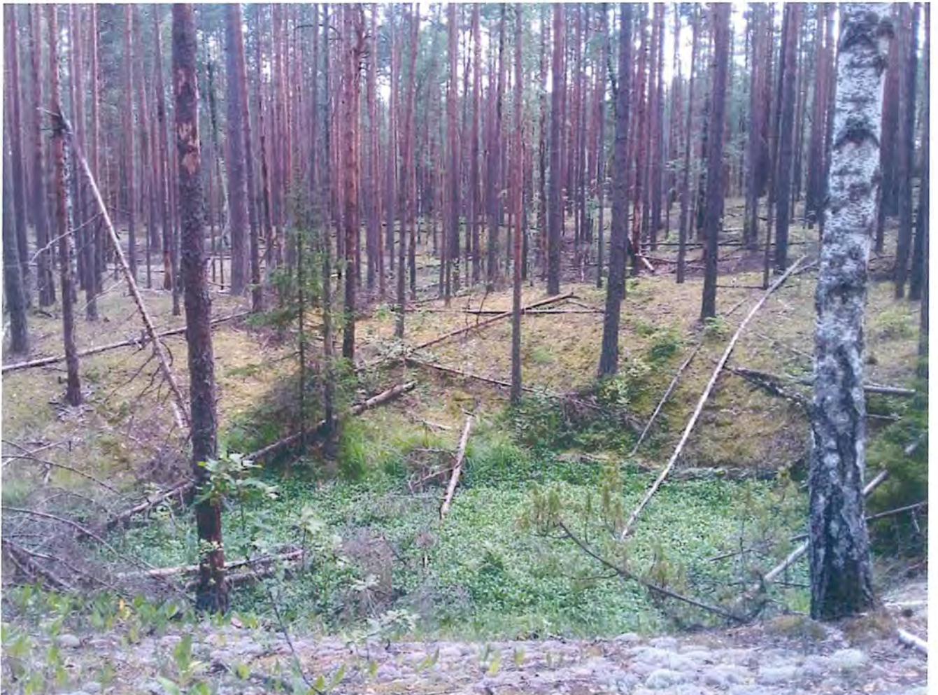
4. Вахтовое болото.