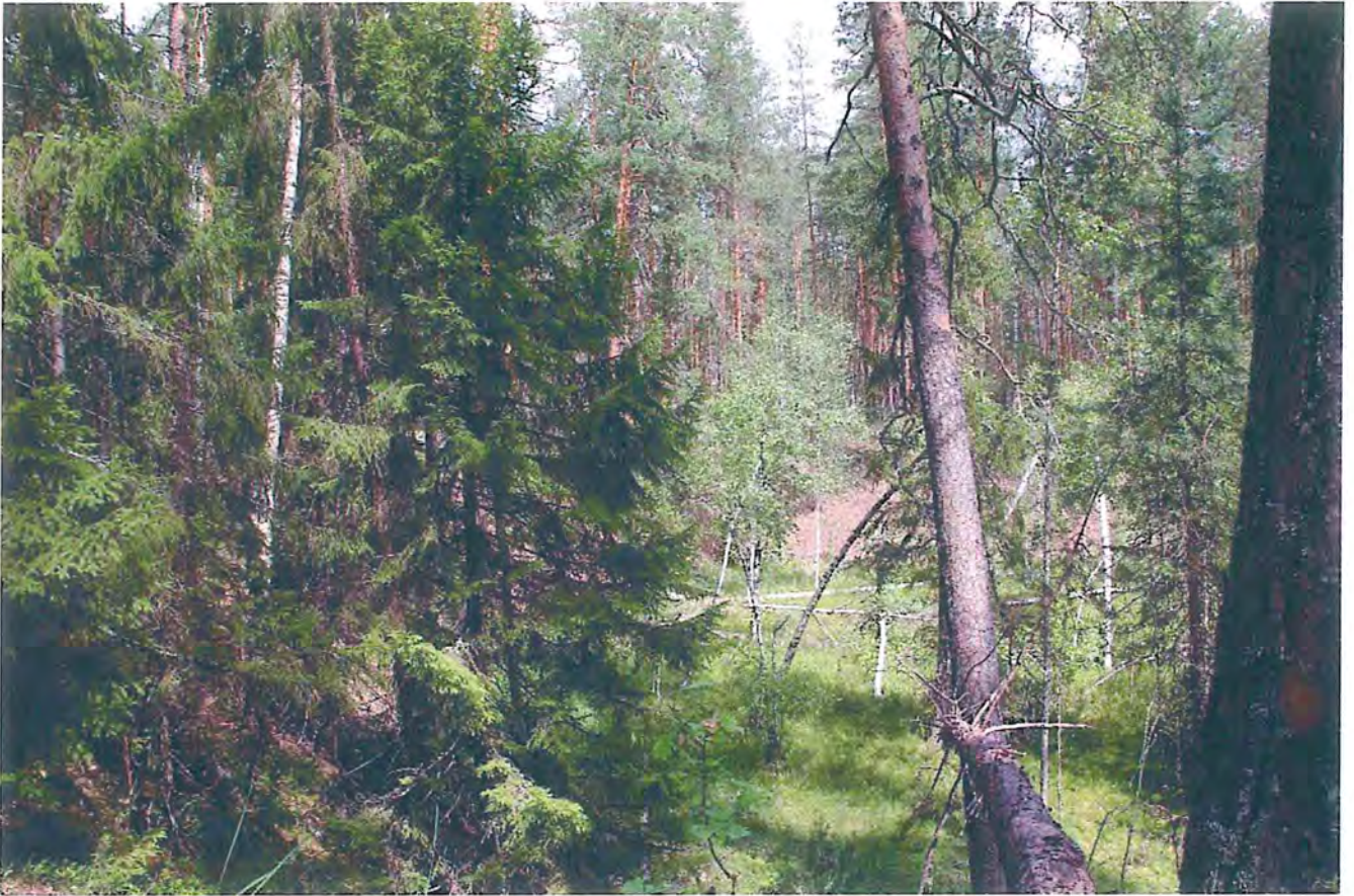
3. Карстовое болото.