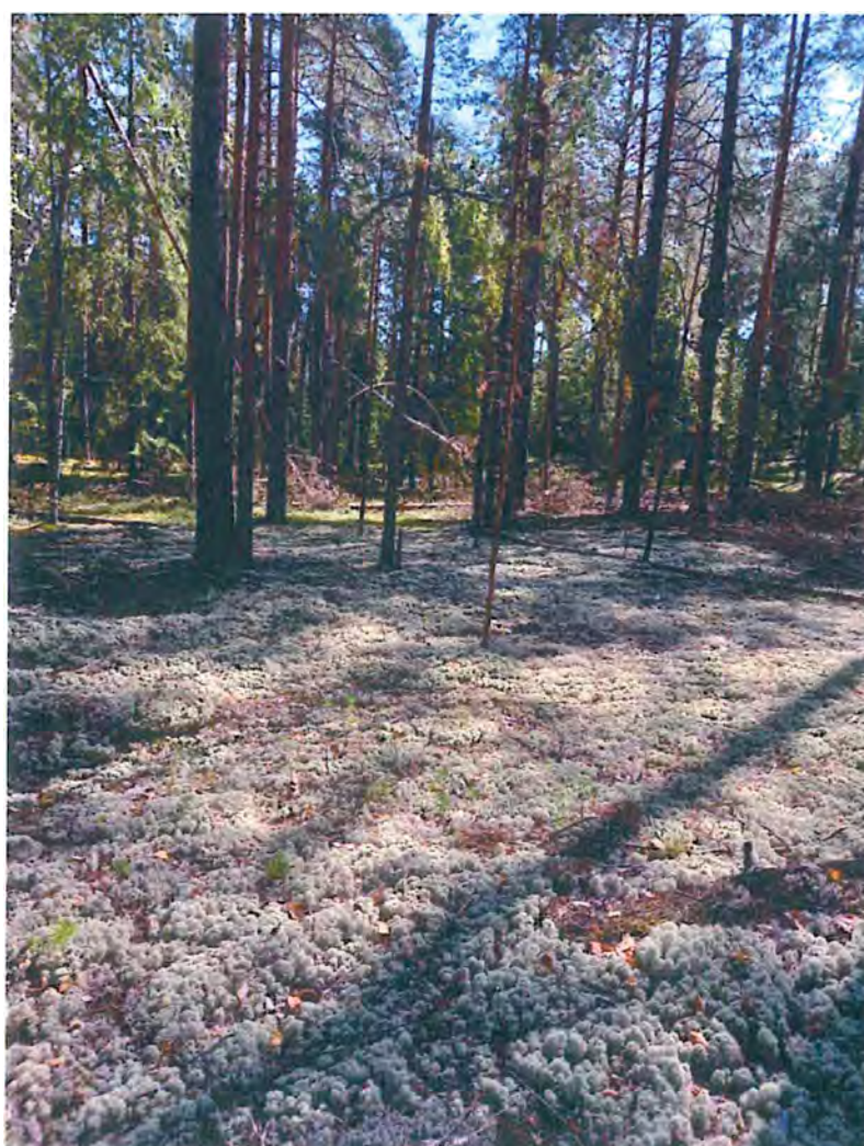
6. Бор-беломошник.