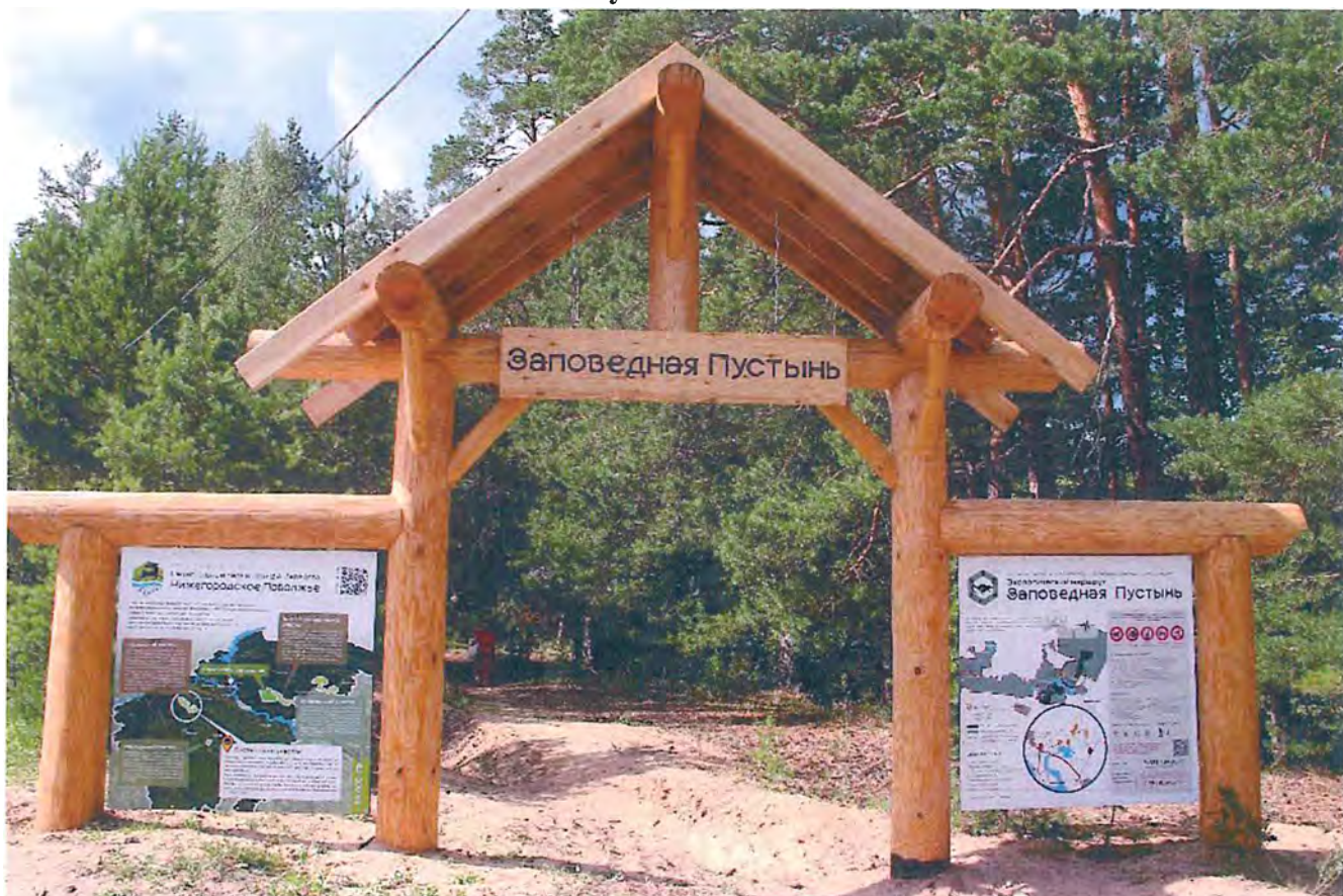
1. Граница национального парка. Входная группа туристского маршрута «Заповедная Пустынь».