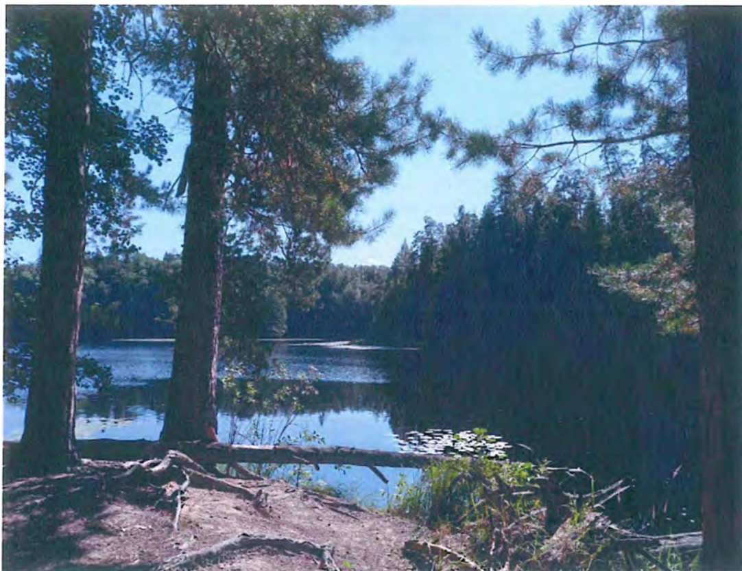
5. Озеро Свято.