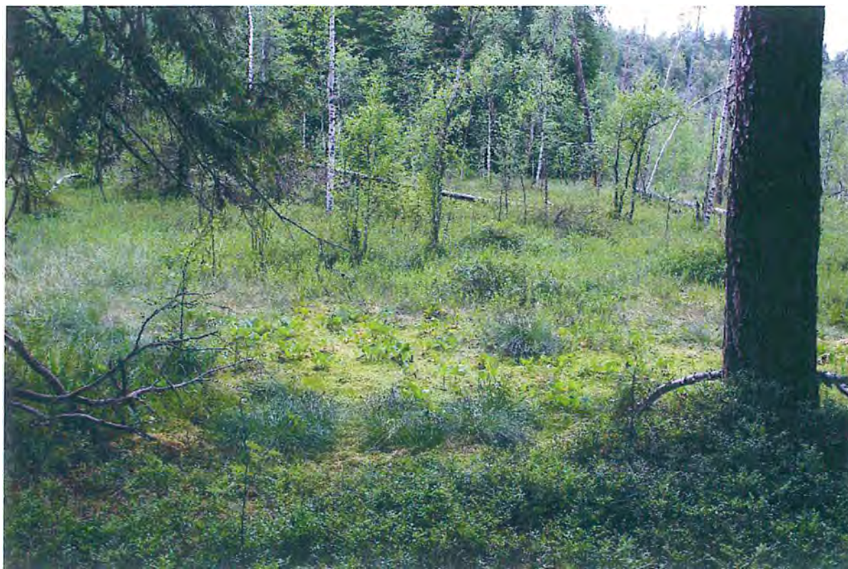
2. Росянковое болото.