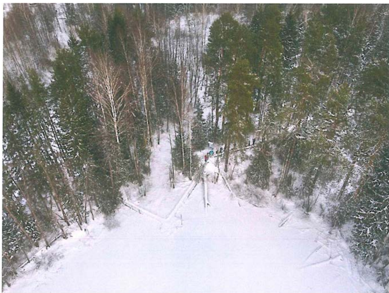
4. Озеро круглое зимой (съемка с БПЛА).