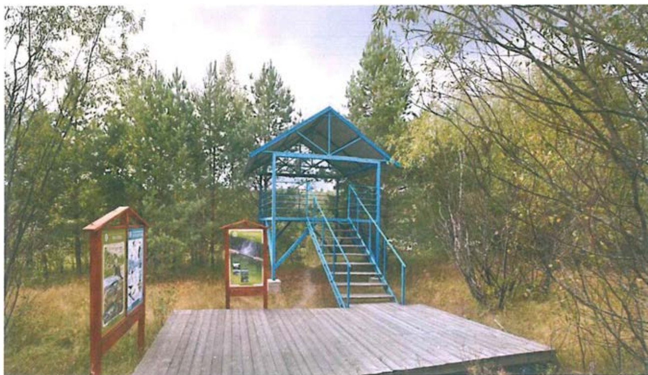
8. Смотровая вышка-беседка на реке Керженец.