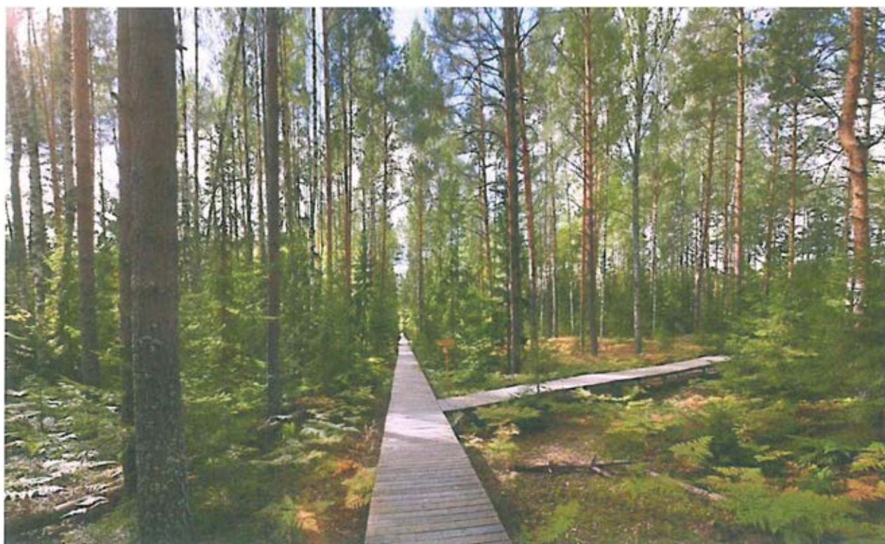
6. Участок между точками 10 и 3. Точка эвакуации. Выход к началу тропы.