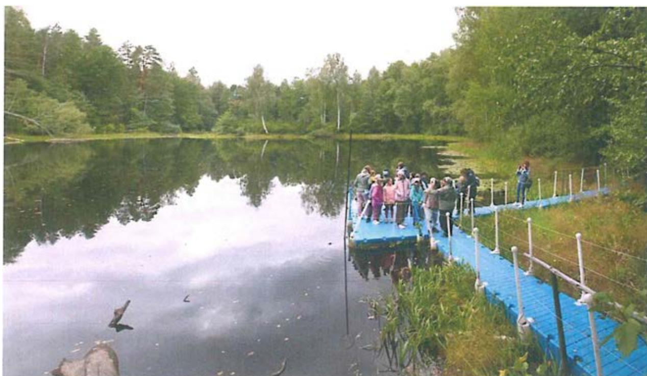
2. Экскурсанты на смотровой площадке «Озеро круглое» летом.