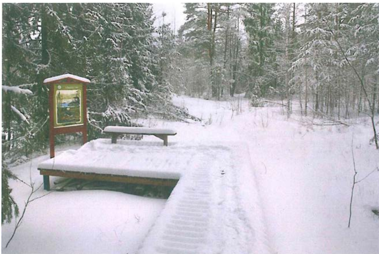
5. Место отдыха на озере Маховское, стенд «Пойменное озеро».