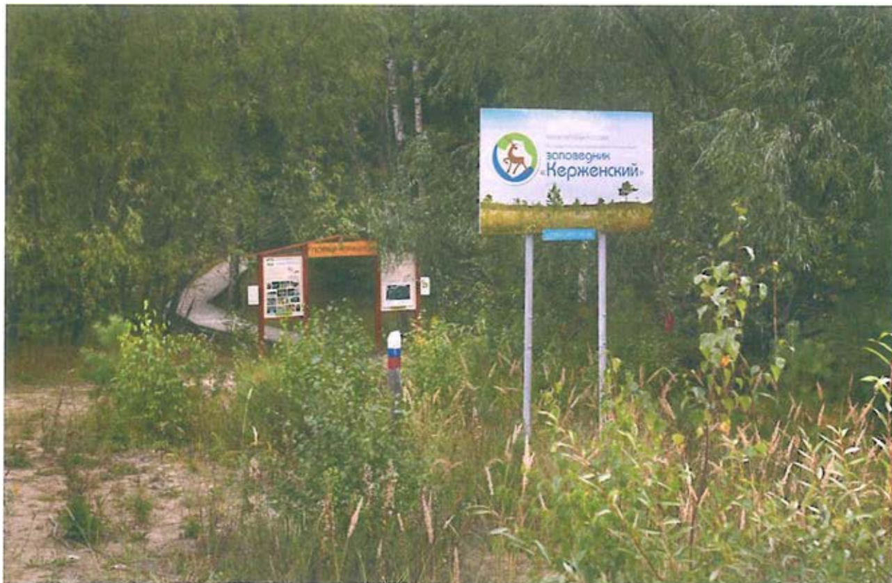
1. Граница заповедника. Входная группа тропы «Пойма Керженца».