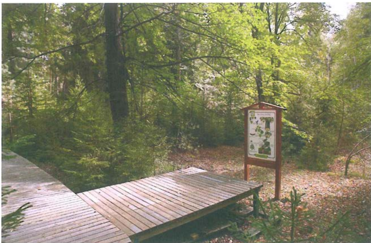
7. Стенд «Жизнь липы».