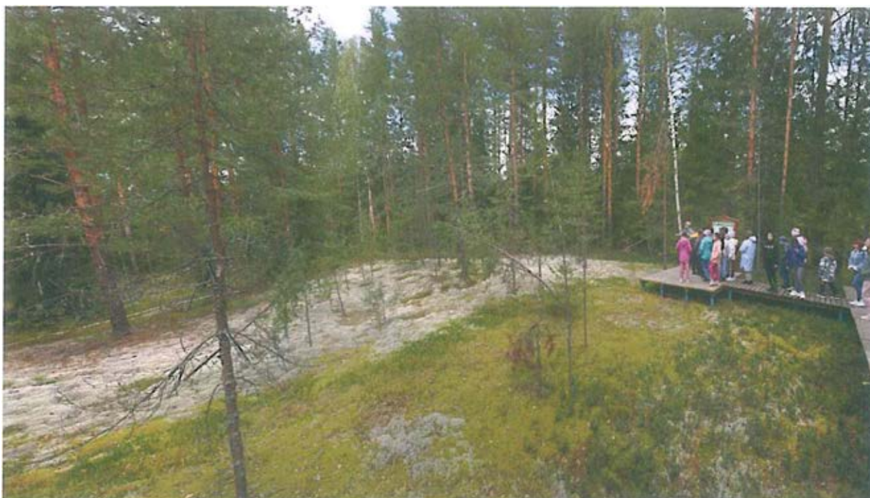
3. Экскурсанты на тематической площадке «Бор-беломошник».