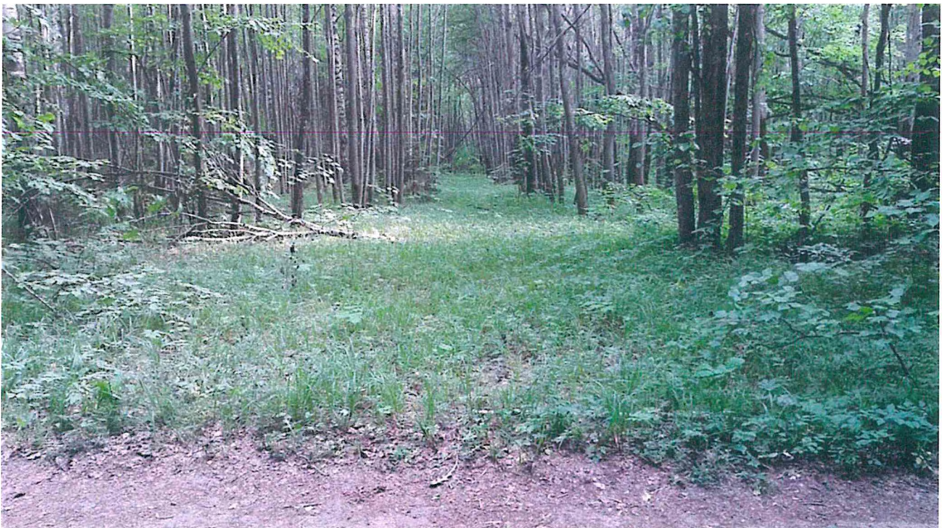
4. Лесной коридор.