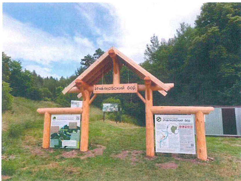
1. Граница национального парка, входная группа туристского маршрута «Ичалковский бор».