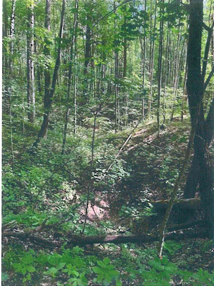
3. Ближний лог.