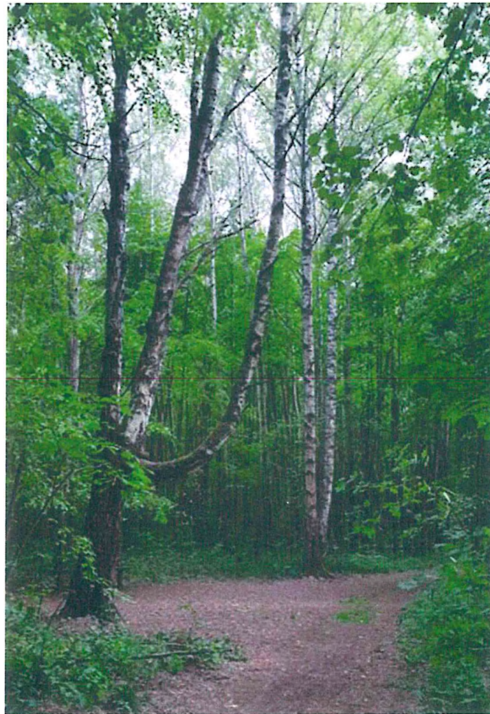
6. Место отдыха.