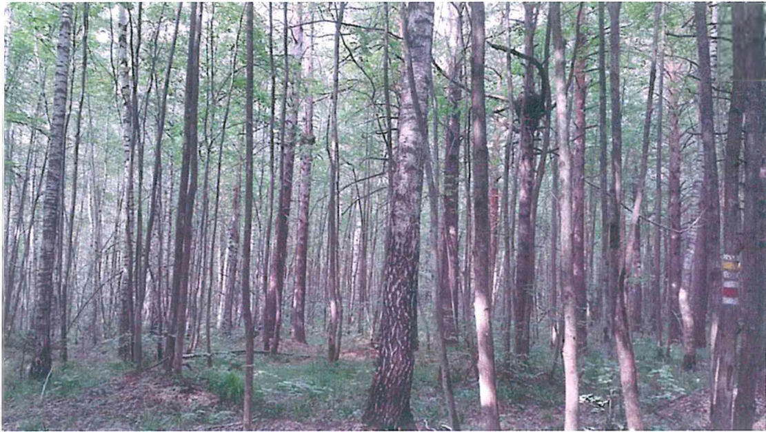
5. Сосна с сувелью.