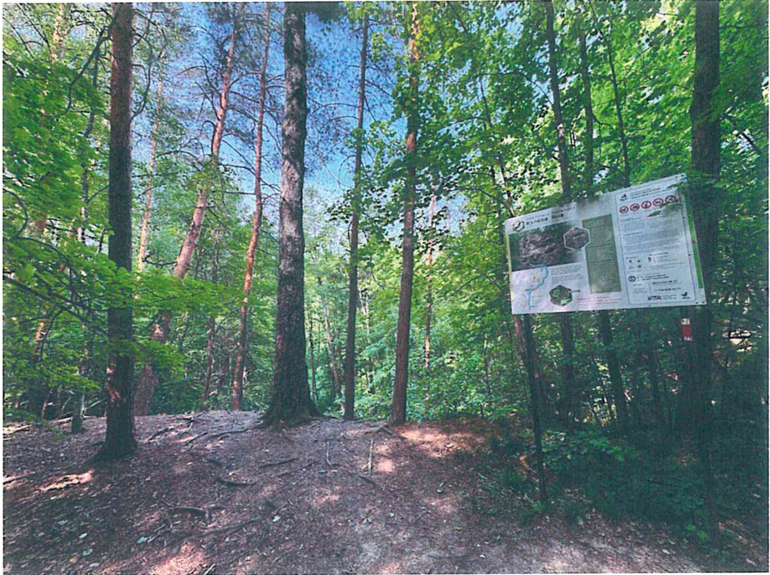
7. Кулева яма.