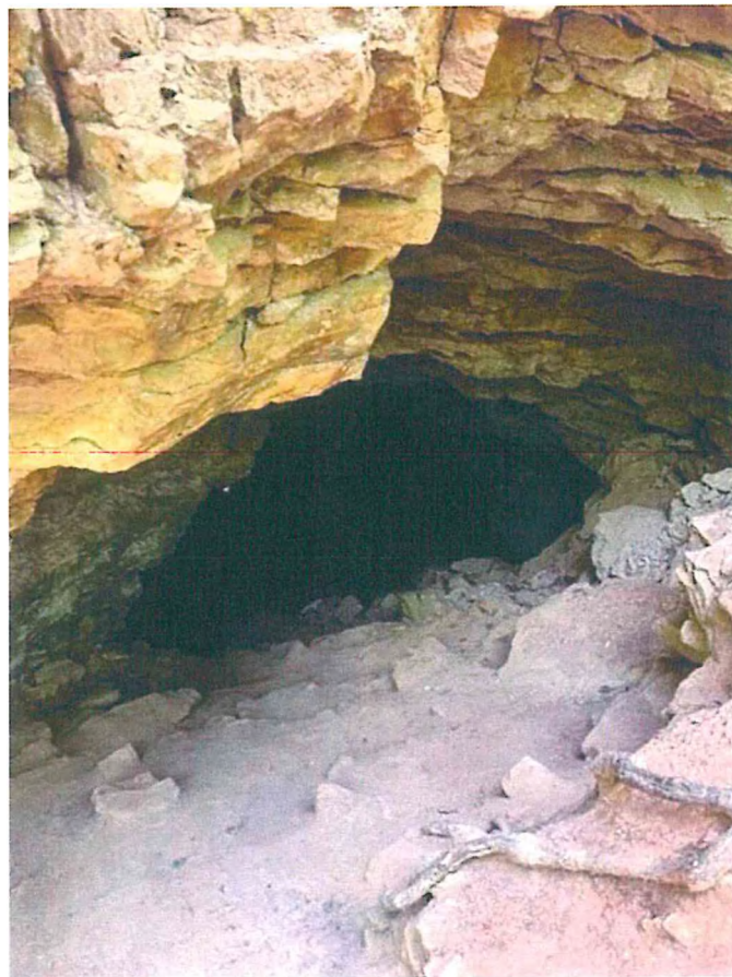
8. Студенческая пещера.