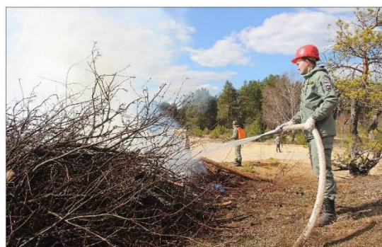
Учения ПХС-1 заповедника

По итогам учений наблюдателями отмечена слаженная эффективная работа пожарных команд и экипажей пожарного транспорта, полная исправность техники, оборудования и инвентаря. Кроме того, подчеркнуто большое значение ПХС-1 не только для охраны лесов заповедника, но и для оперативного оказания помощи по-