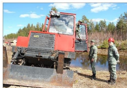
Пожарная бригада и трактор ТТ-4М