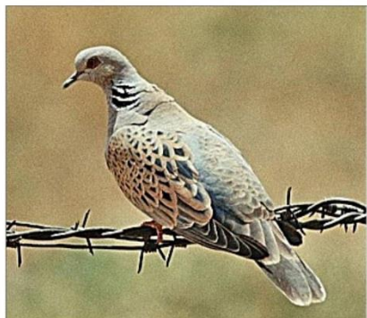
Обыкновенная горлица.

Гнезда горлица устраивает на ветках деревьев, откладывает два яйца. Птенцов все голуби выкармливают «птичьим молоком» – особым секретом, выделяемым стенками зоба. Позже к нему добавляются полупереваренные зерна. Голуби образуют прочную пару и,