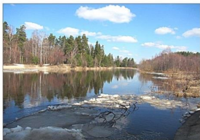
Ледоход на Керженце

В 2019 году на реках Керженского заповедника паводок был крайне низким. В р. Вишня к 13 апреля вода поднялась до отметки 145 см. Меньше было только в 2002 году (116 см). Максимальный