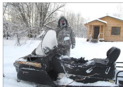
Зимний рейд на снегоходе

Один из нарушителей запомнился необычайной целеустремленностью. Будучи дважды предупрежден о том, что своими действиями нарушает режим заповедника, он вскоре в точности их повторил, чем добился-таки составления протокола. Но на этом не остановился, и до рассмотрения дела сумел закрепить результат, допустив то же нарушение на том же месте.