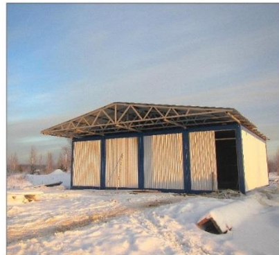
Строительство нового ФАП в п. Рустай

С 14 декабря 2020 г. в п. Большеорловское и п. Рустай планируется работа участкового уполномочен-