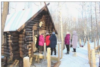
«Избушка на курьих ножках»